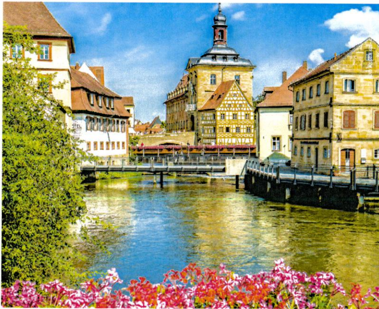
Altes Rathaus von Bamberg